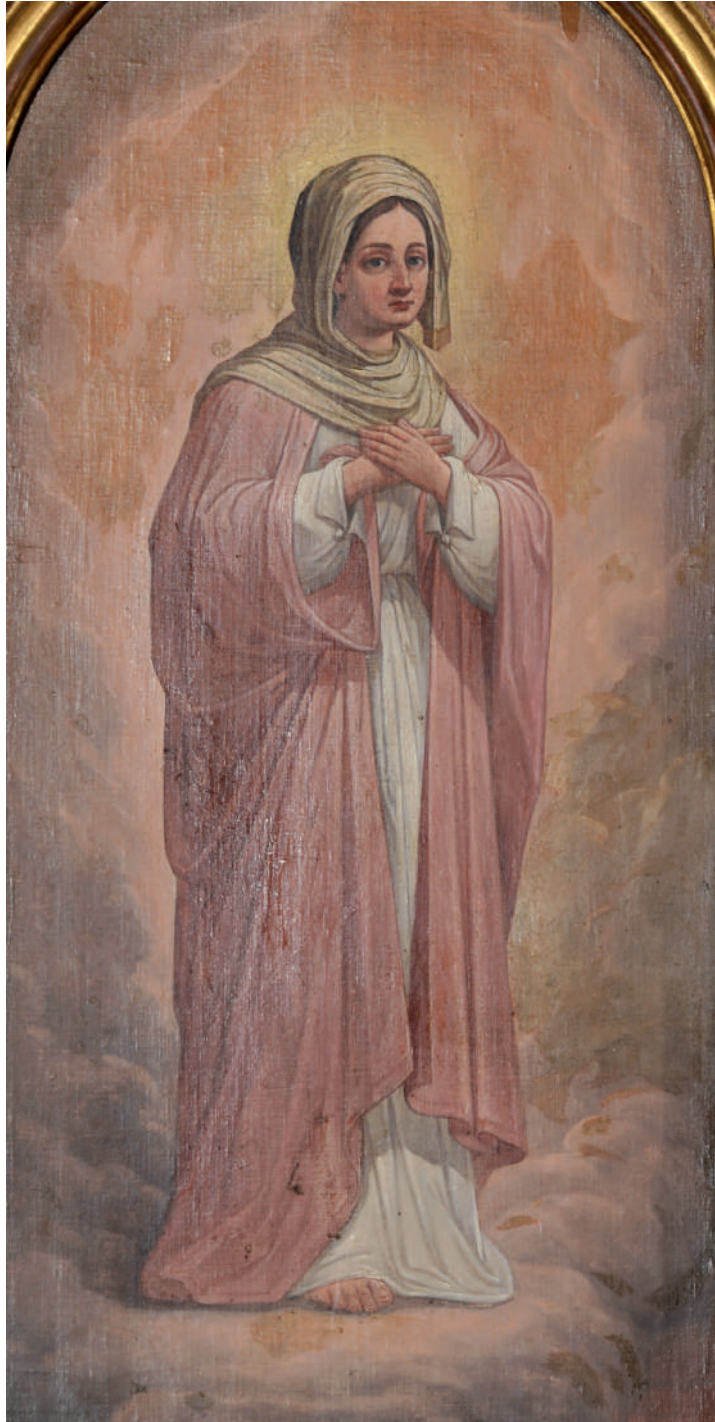
Fecioara Maria (detaliu)