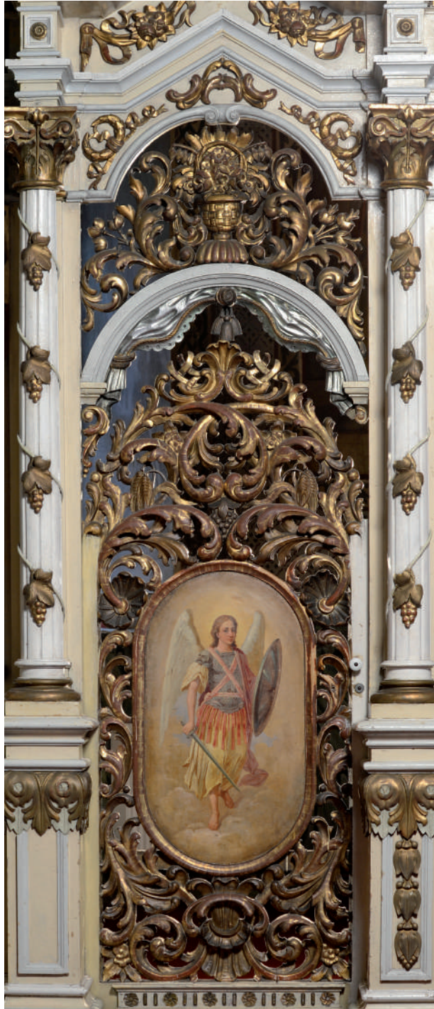
Sfântul Arhanghel Mihail (Ușă diaconească partea nordică)