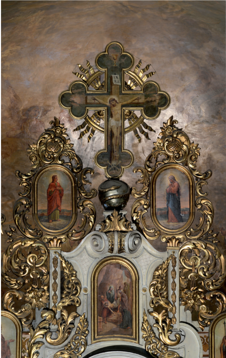
Răstignirea Domnului (Sfânta Cruce cu Molenii) și Coborârea de pe cruce (detaliu)