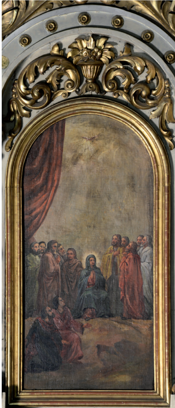
Pogorârea Sfântului Duh