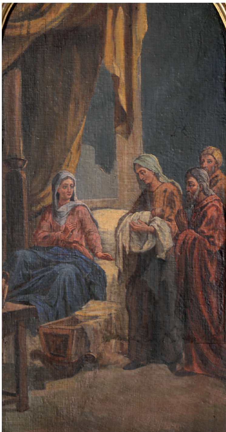
Nașterea Maicii Domnului (detaliu)