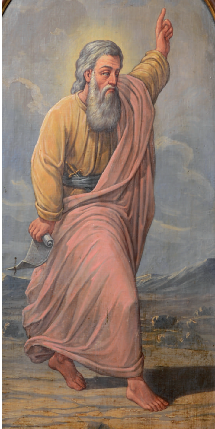
Sfântul Prooroc Ilie Tesviteanu (detaliu)