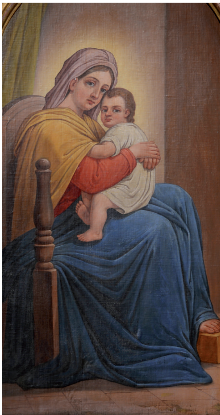
Maica Domnului cu Pruncul (Scaun arhieresc – nord) (detaliu)