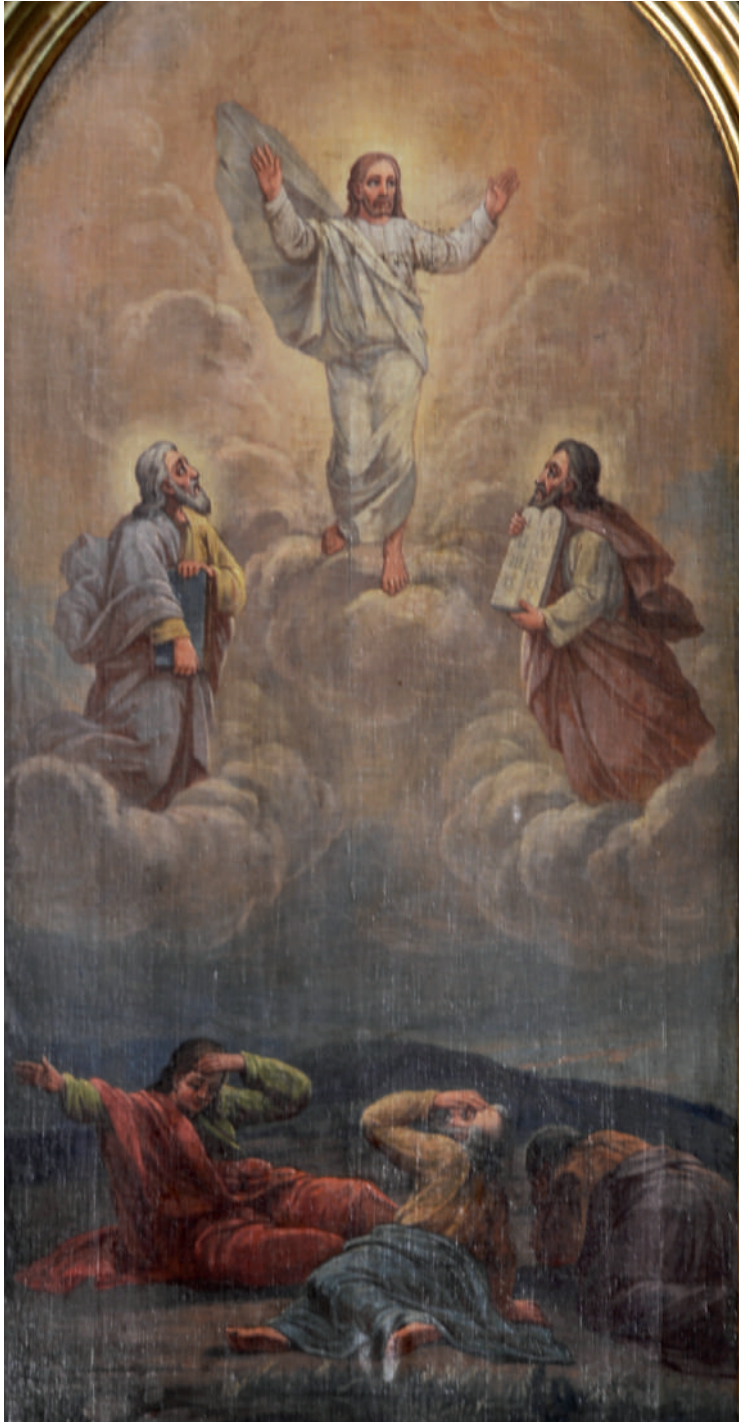
Schimbarea la față a Mântuitorului (detaliu)