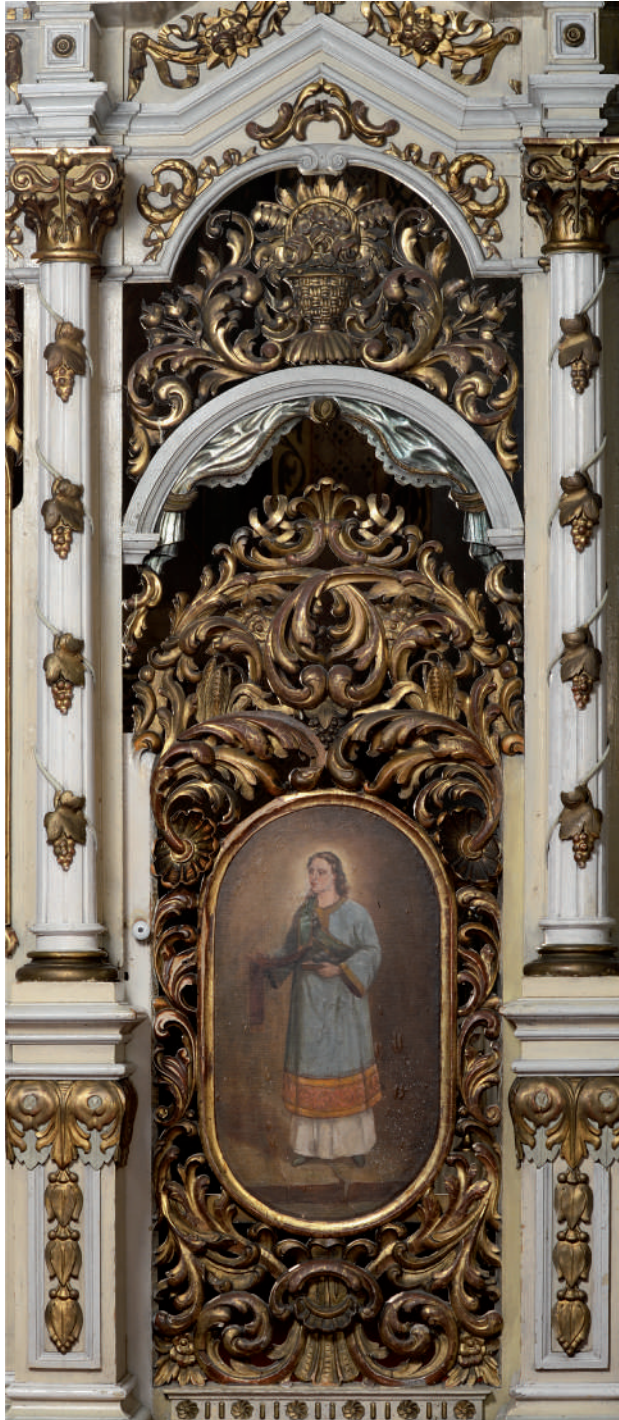
Sfântul Arhidiacon Ștefan (Ușă diaconească partea sudică)