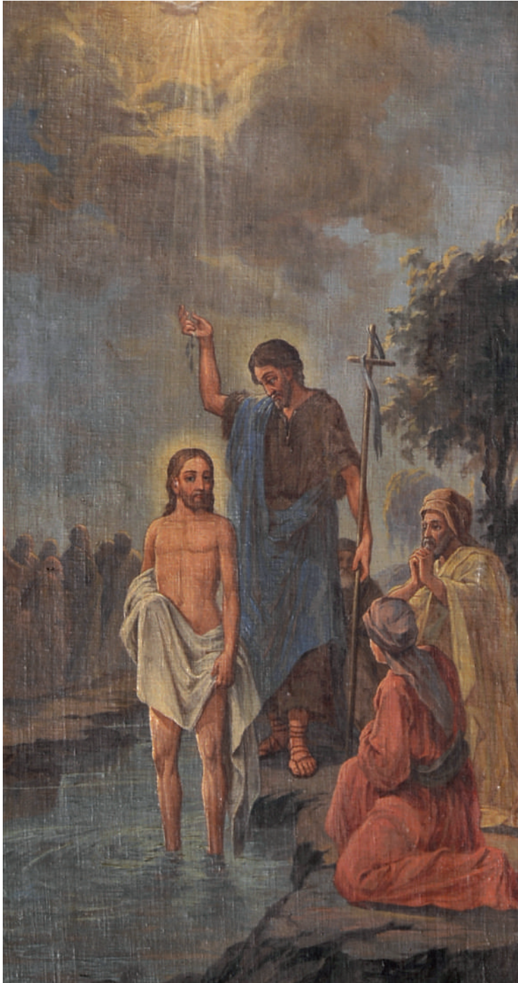
Botezul Domnului (detaliu)