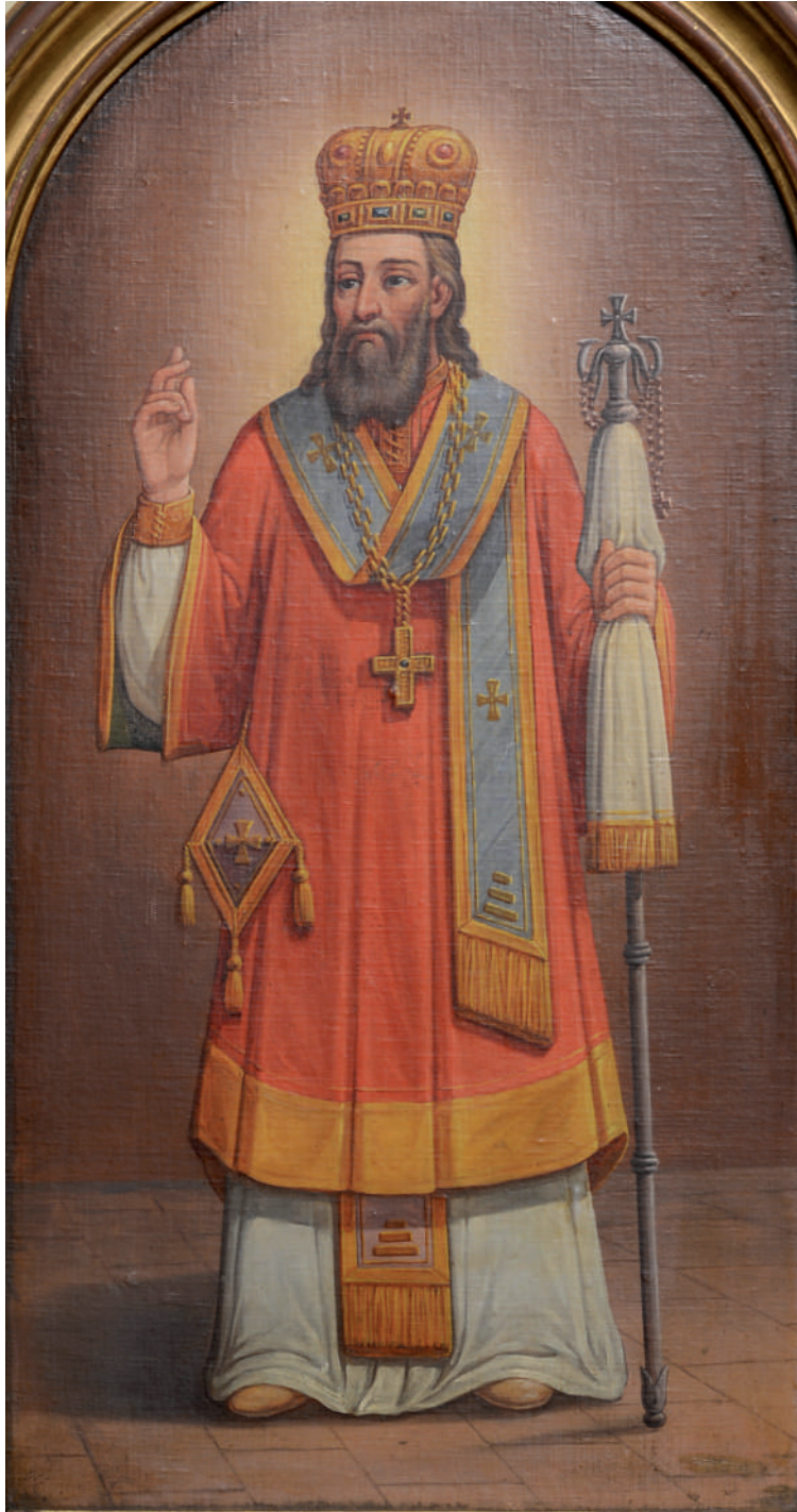
Arhiereu (Scaun arhieresc – sud) (detaliu)