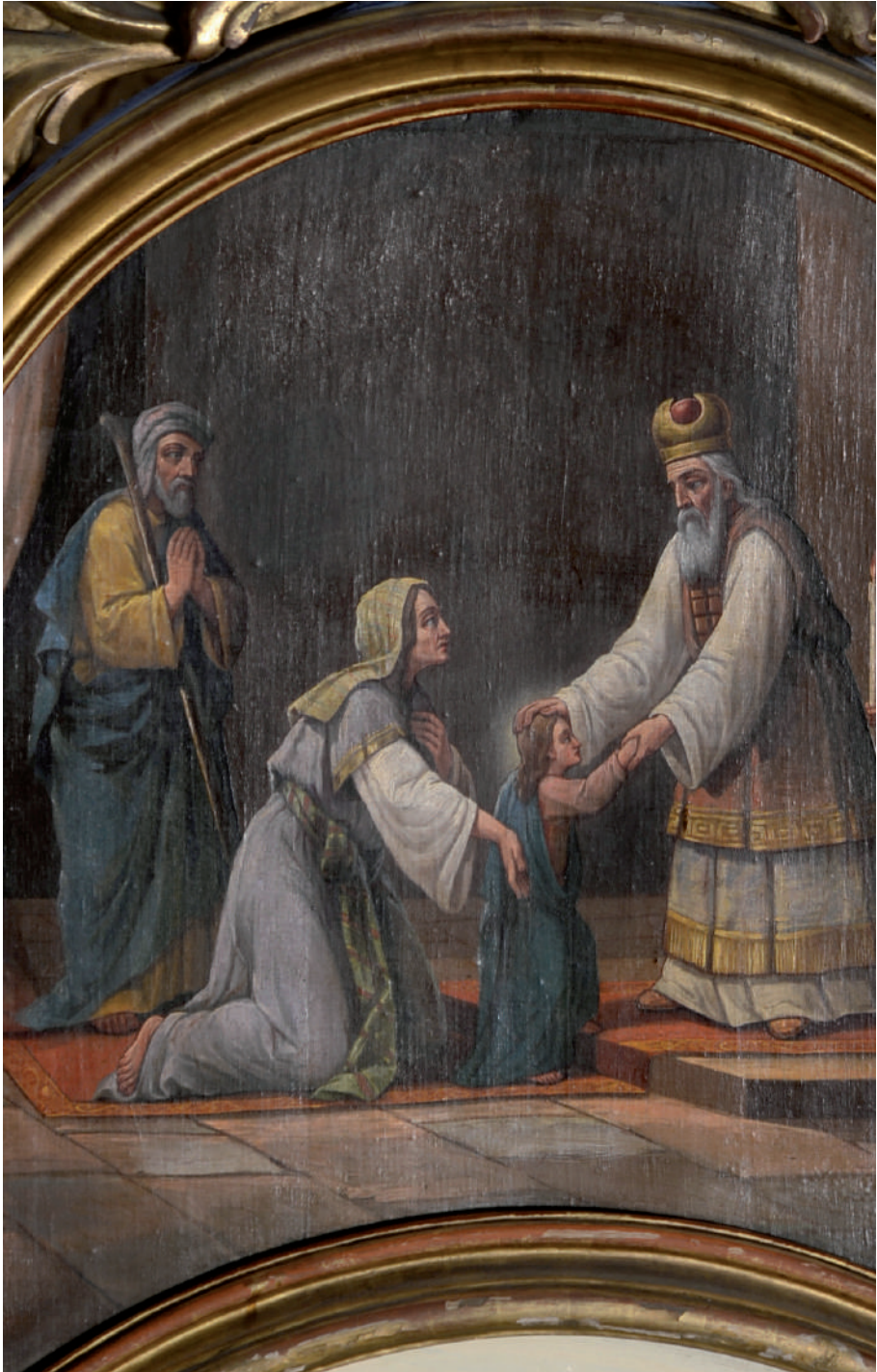
Intrarea Maicii Domnului în biserică (detaliu)