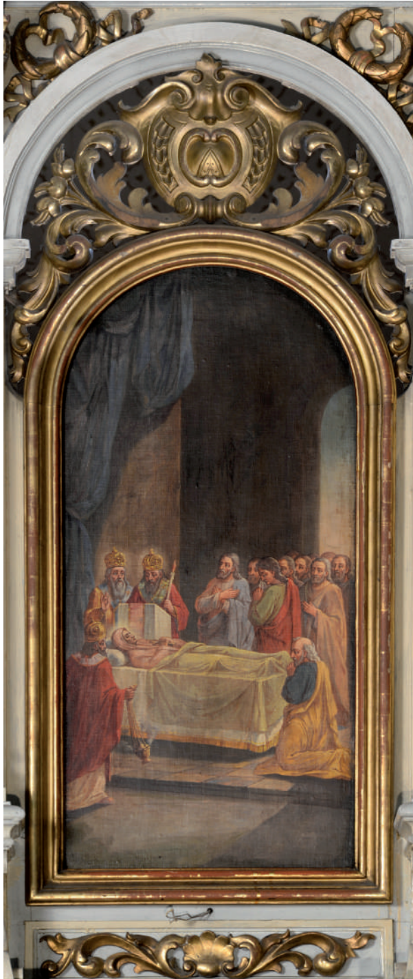
Adormirea Maicii Domnului