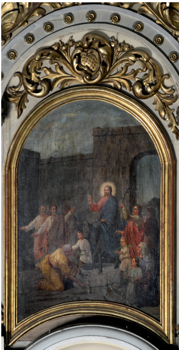
Intrarea Mântuitorului în Ierusalim