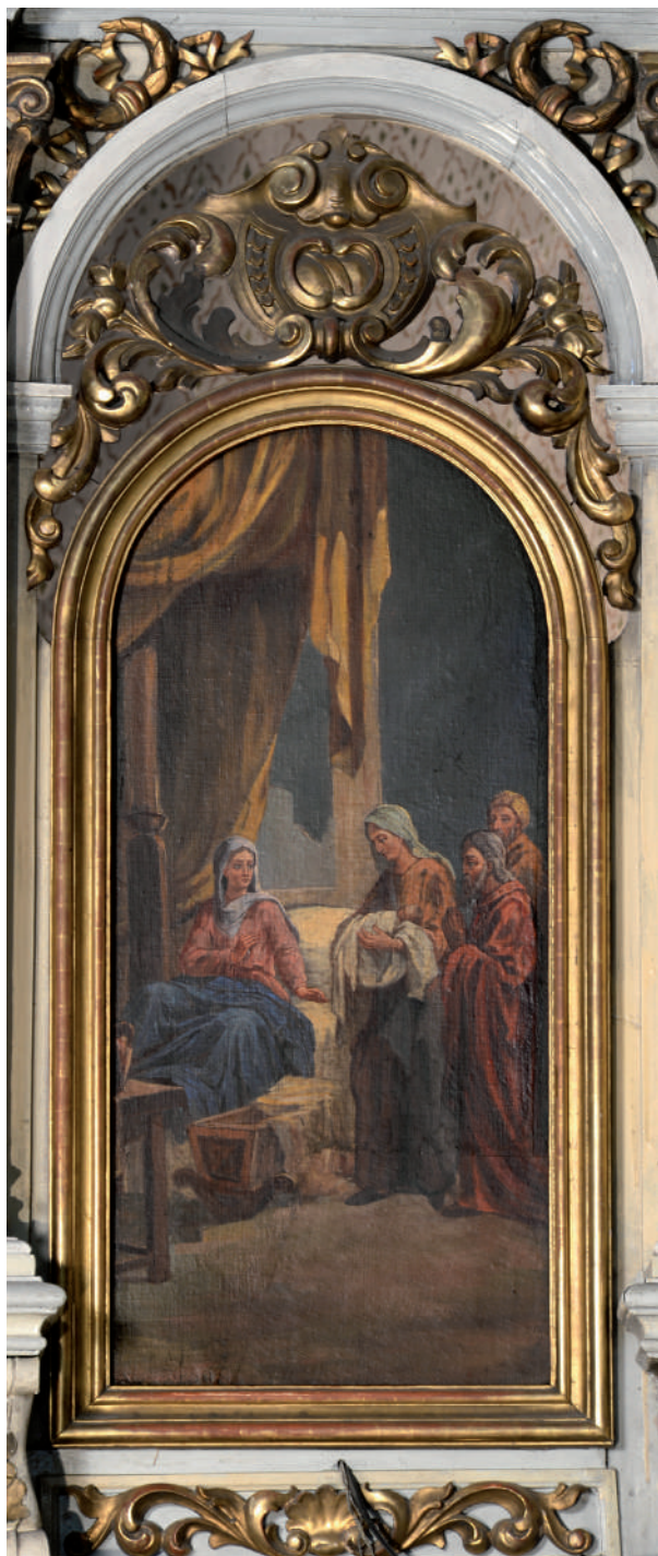
Nașterea Maicii Domnului