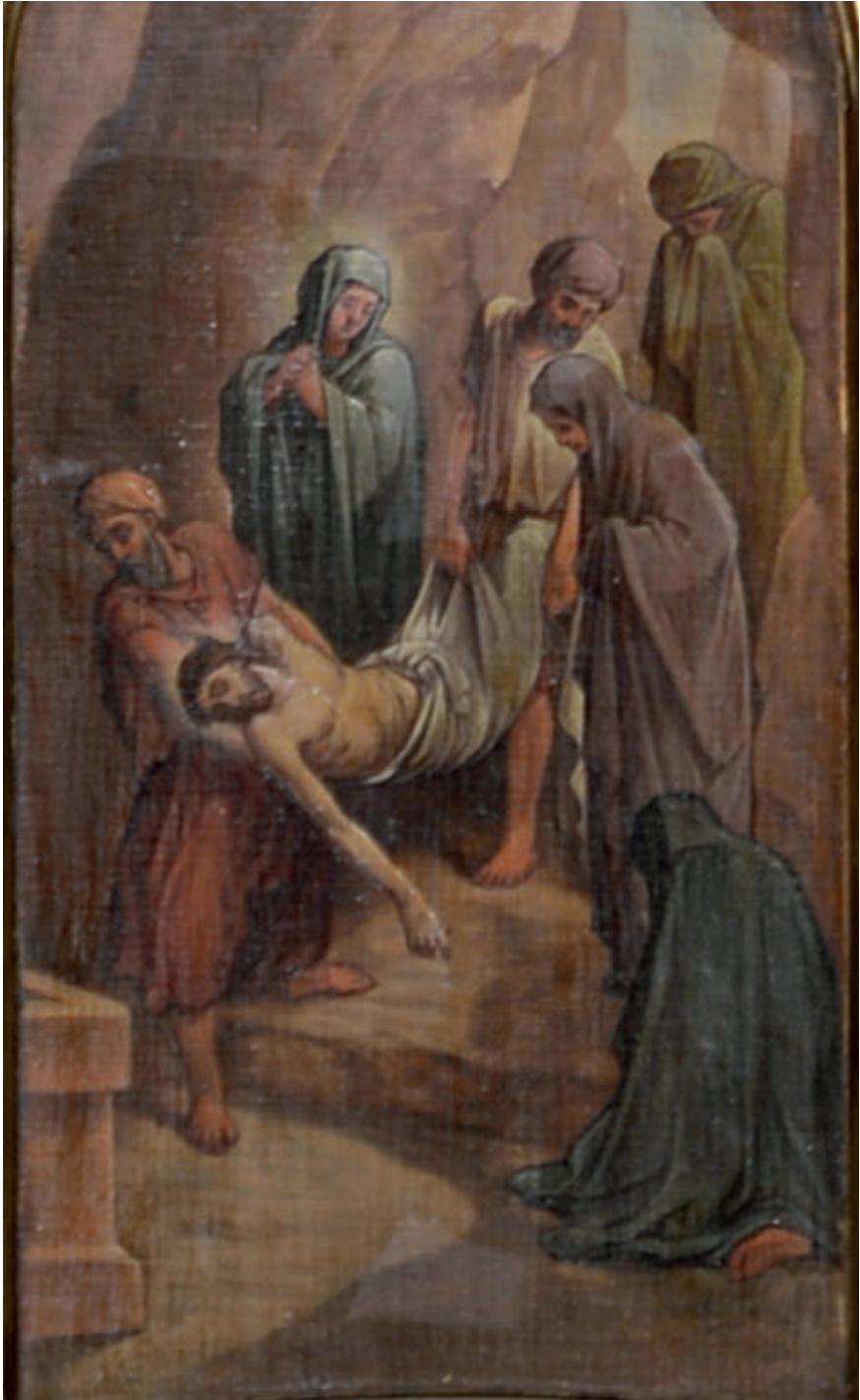
Coborârea de pe cruce (detaliu)