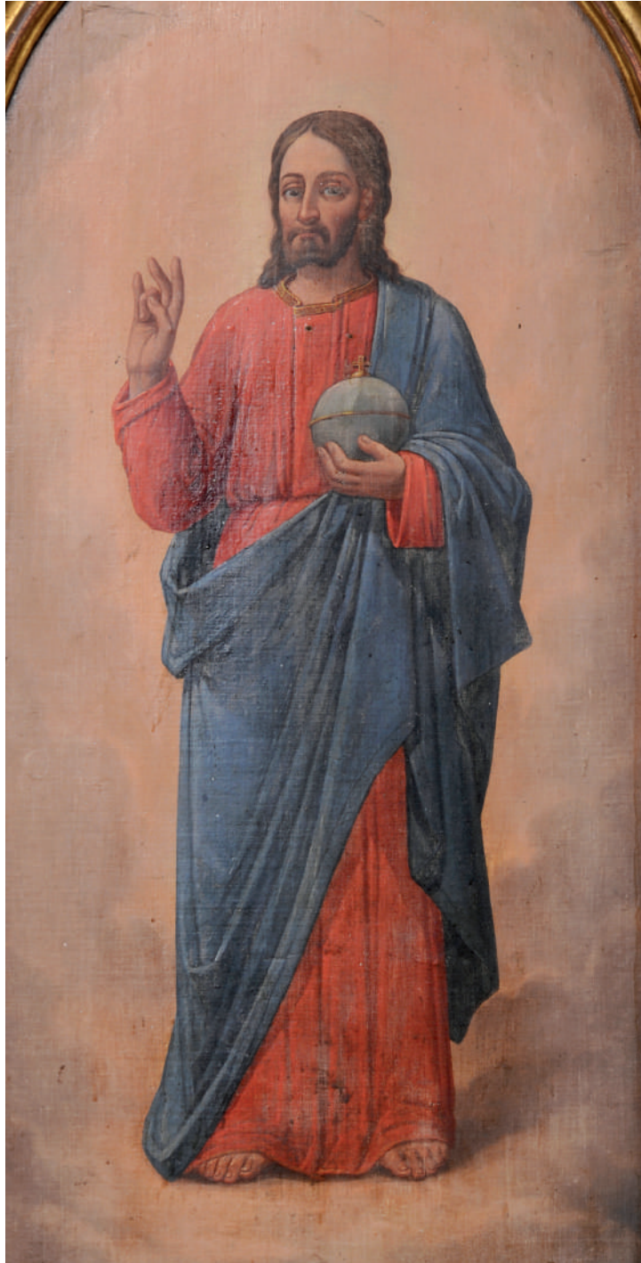
Mântuitorul Iisus Hristos (detaliu)