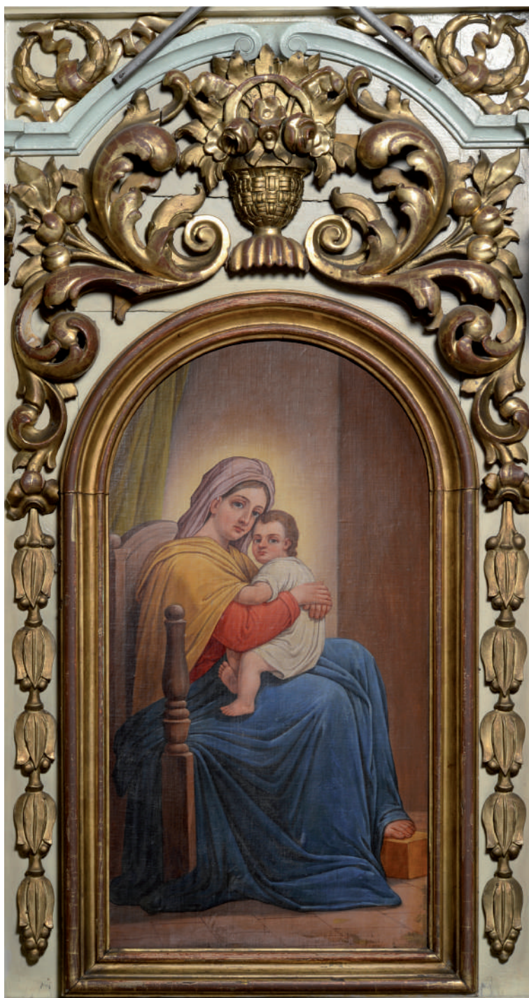
Maica Domnului cu Pruncul (Scaun arhieresc – nord)