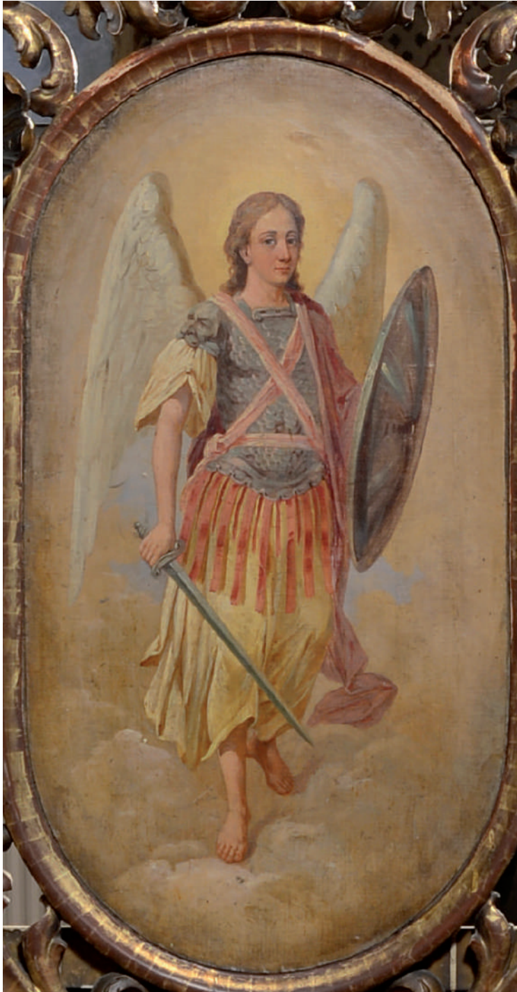
Sfântul Arhanghel Mihail (detaliu)