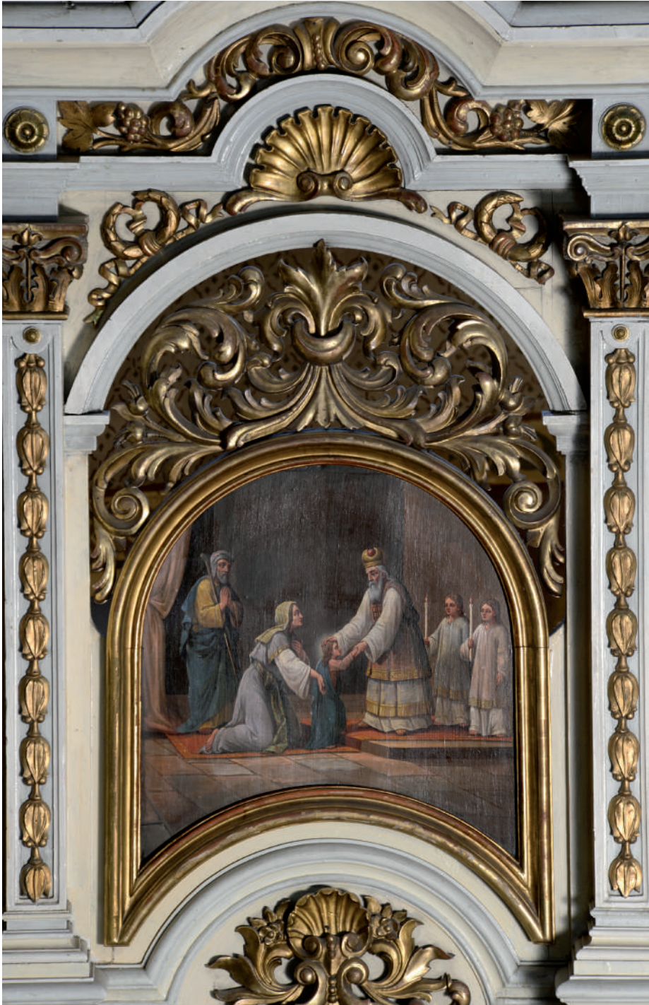
Intrarea Maicii Domnului în biserică