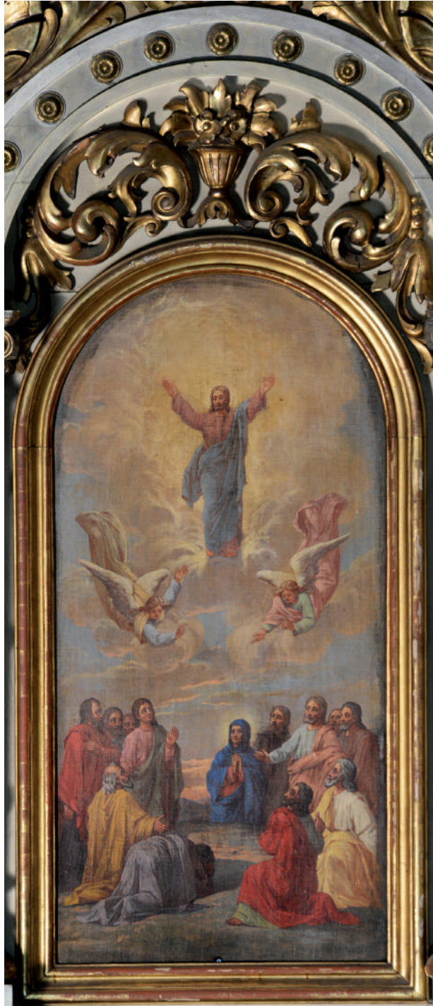
Înălțarea Domnului la cer