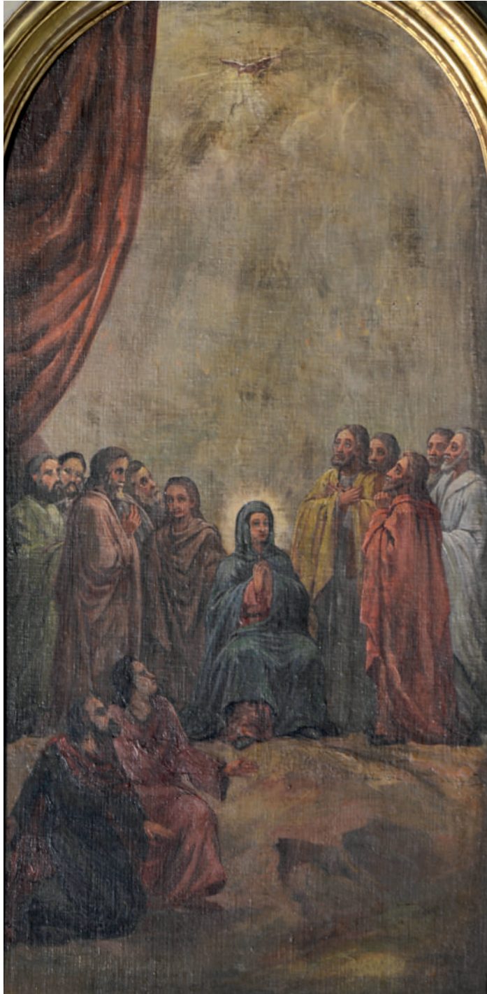
Pogorârea Sfântului Duh (detaliu)