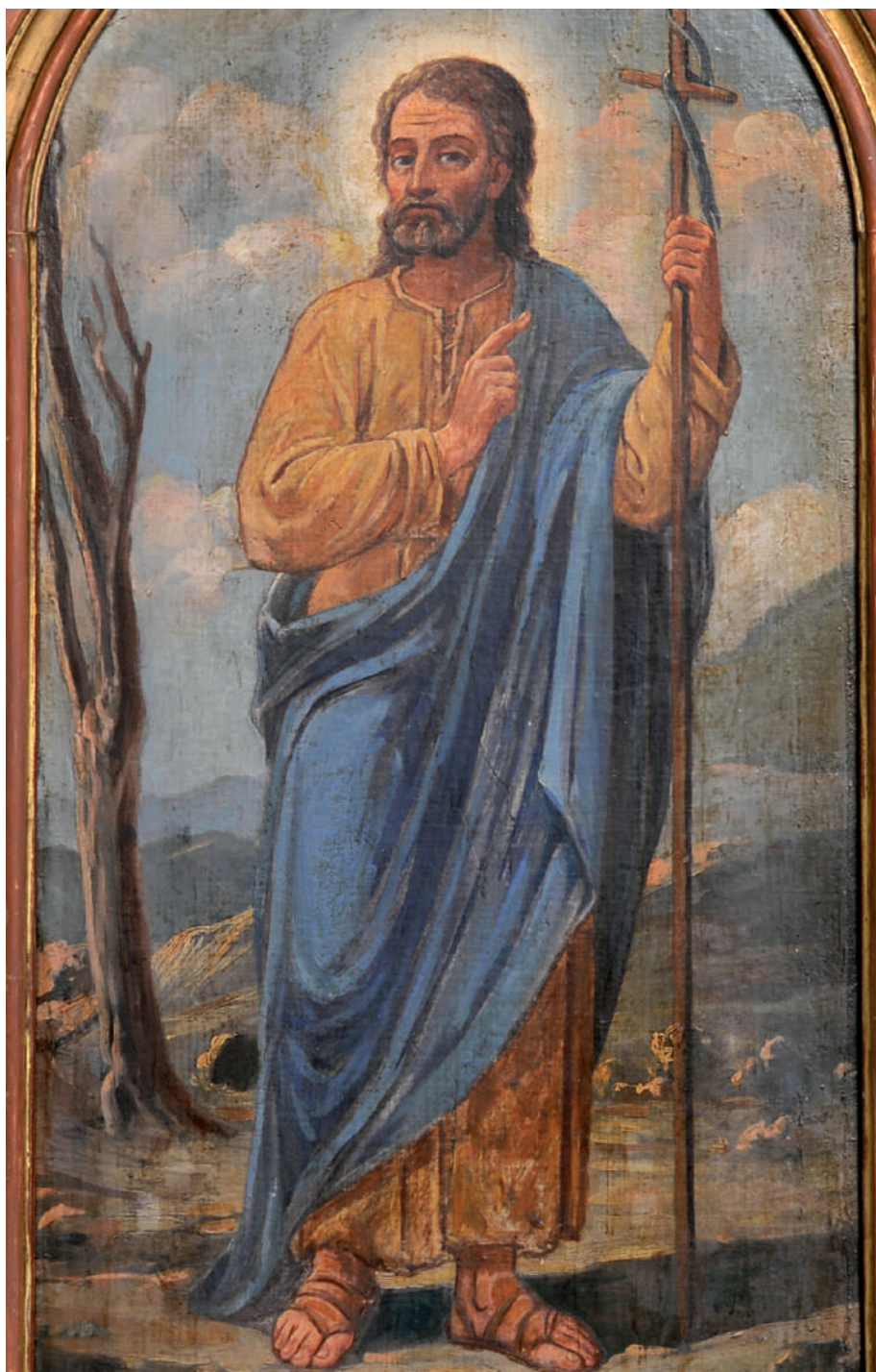
Sfântul Ioan Botezătorul (detaliu)