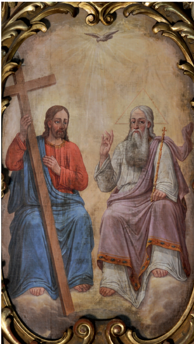
Sfânta Treime (detaliu)