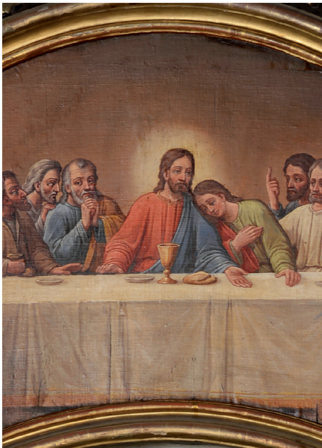
Cina cea de Taină (detaliu)