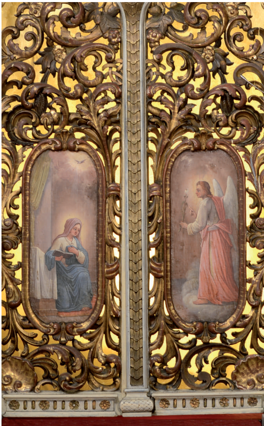
Buna Vestire. Uși Împărățești (detaliu)