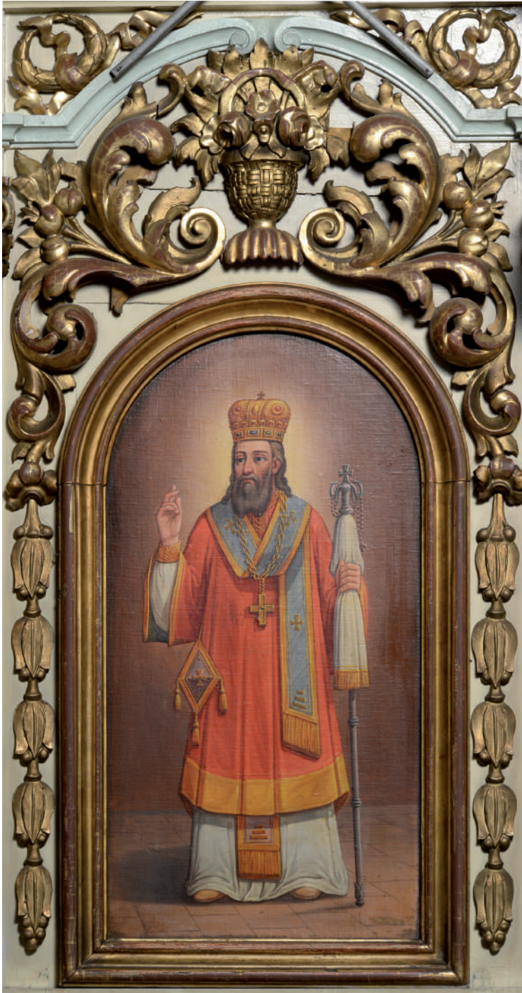
Arhiereu (Scaun arhieresc – sud)