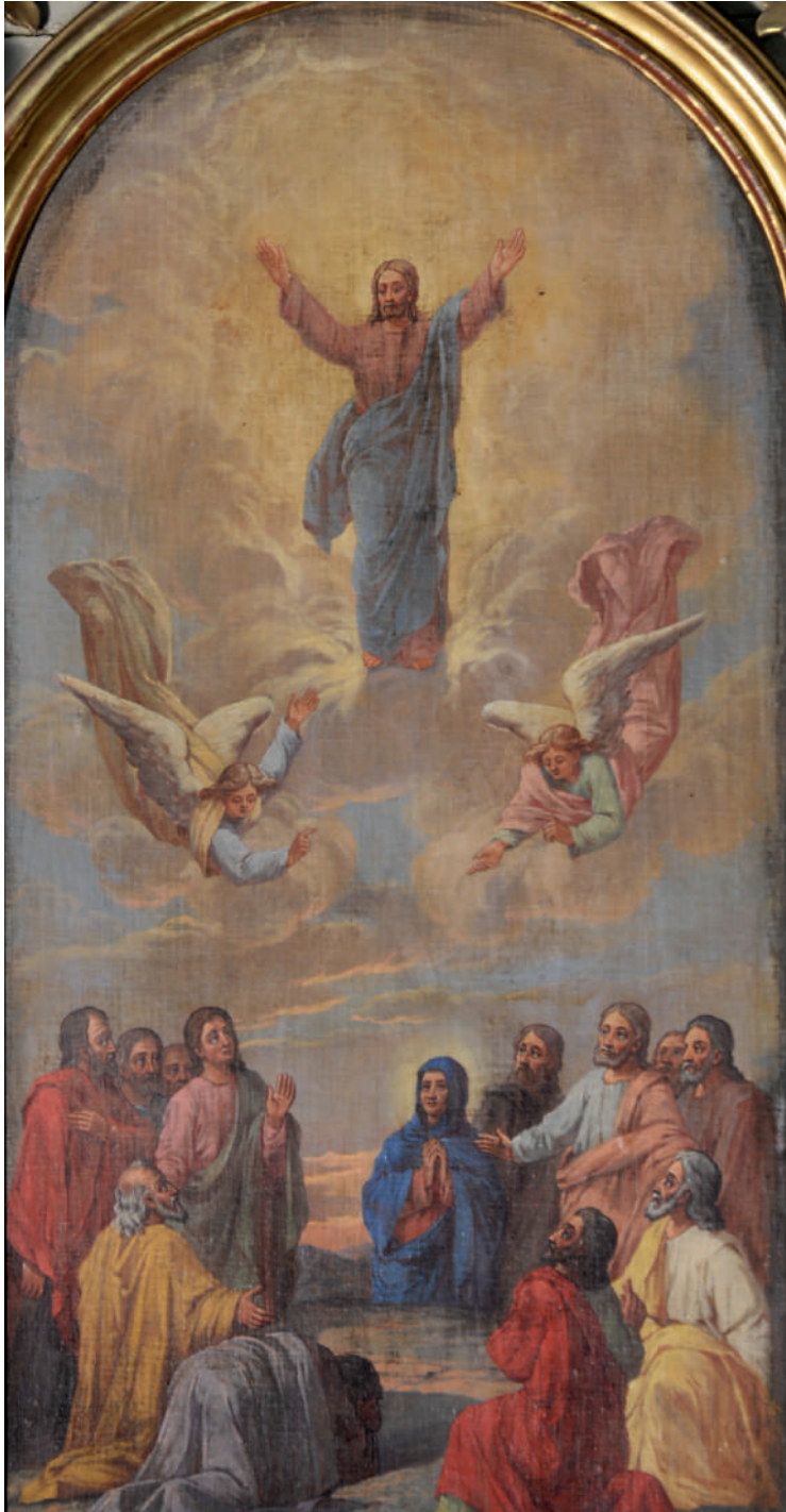
Înălțarea Domnului la cer (detaliu)