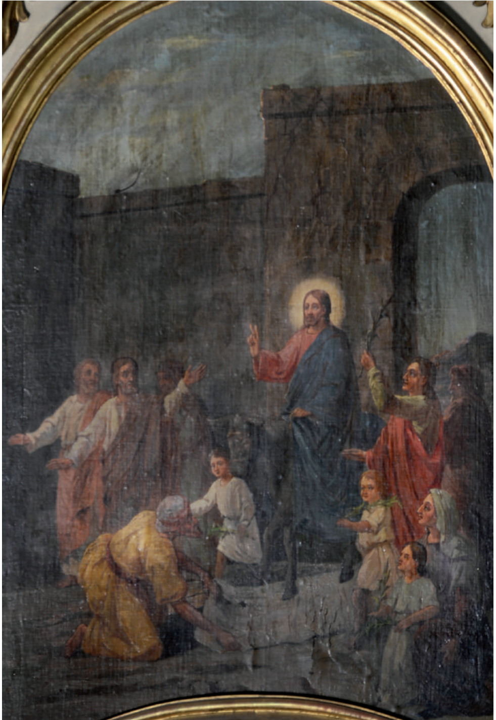
Intrarea Mântuitorului în Ierusalim (detaliu)