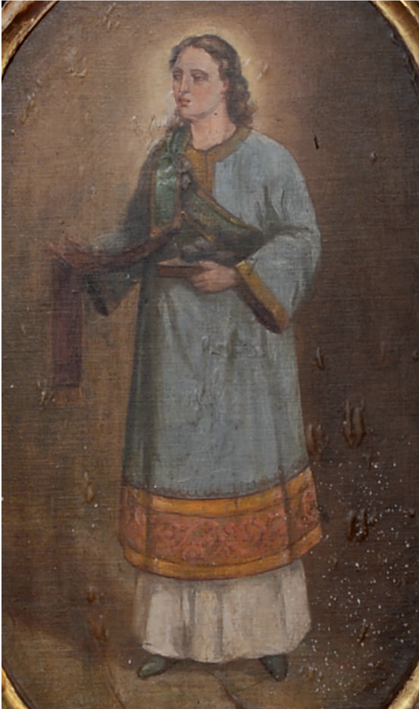
Sfântul Arhidiacon Ștefan (detaliu)