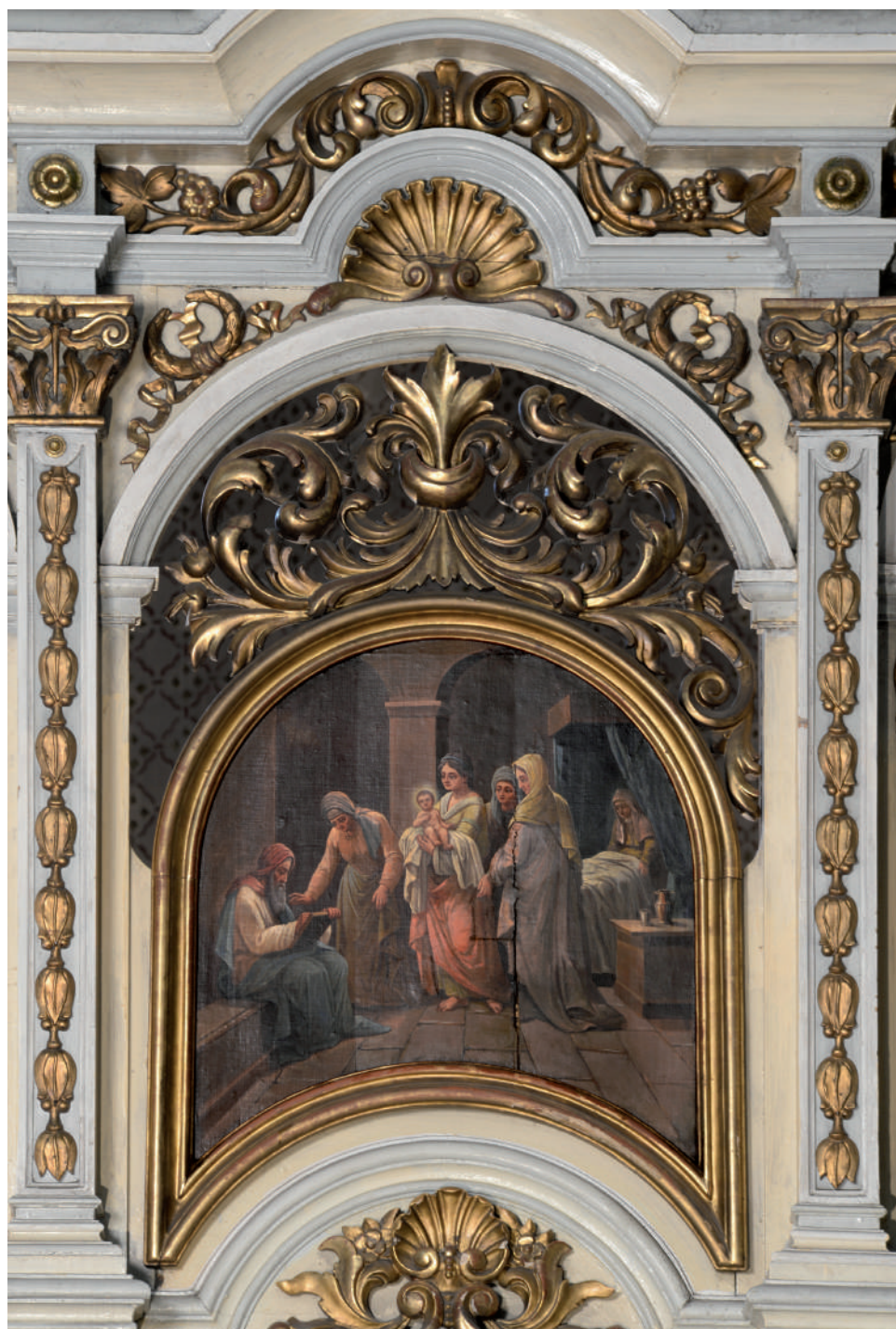
Nașterea Sfântului Ioan Botezătorul