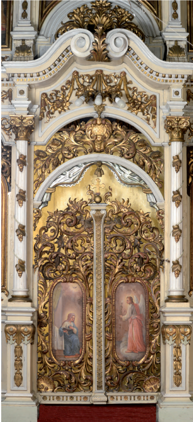
Buna Vestire. Uși Împărățești