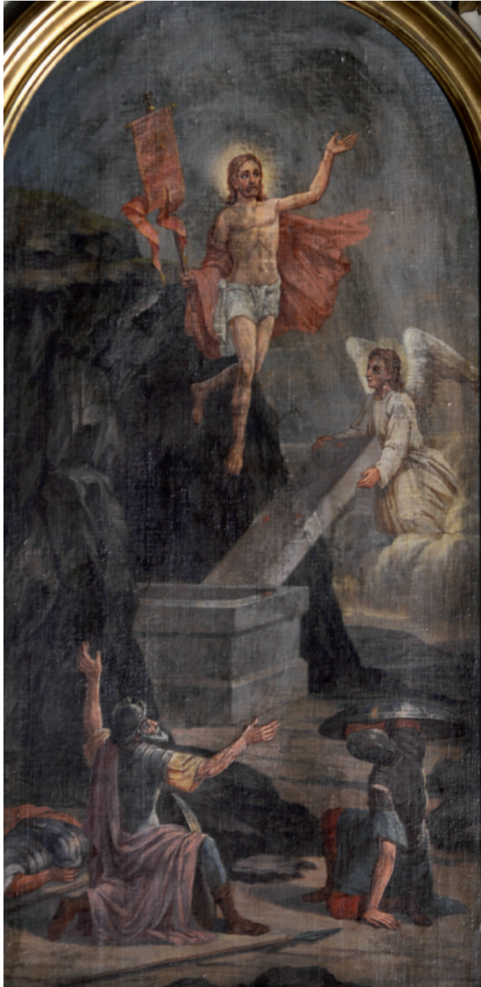
Învierea Domnului (detaliu)