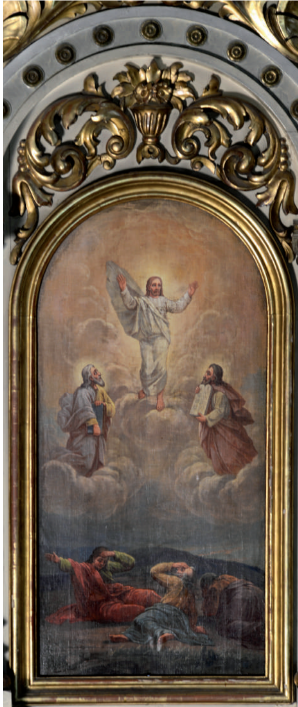
Schimbarea la față a Mântuitorului