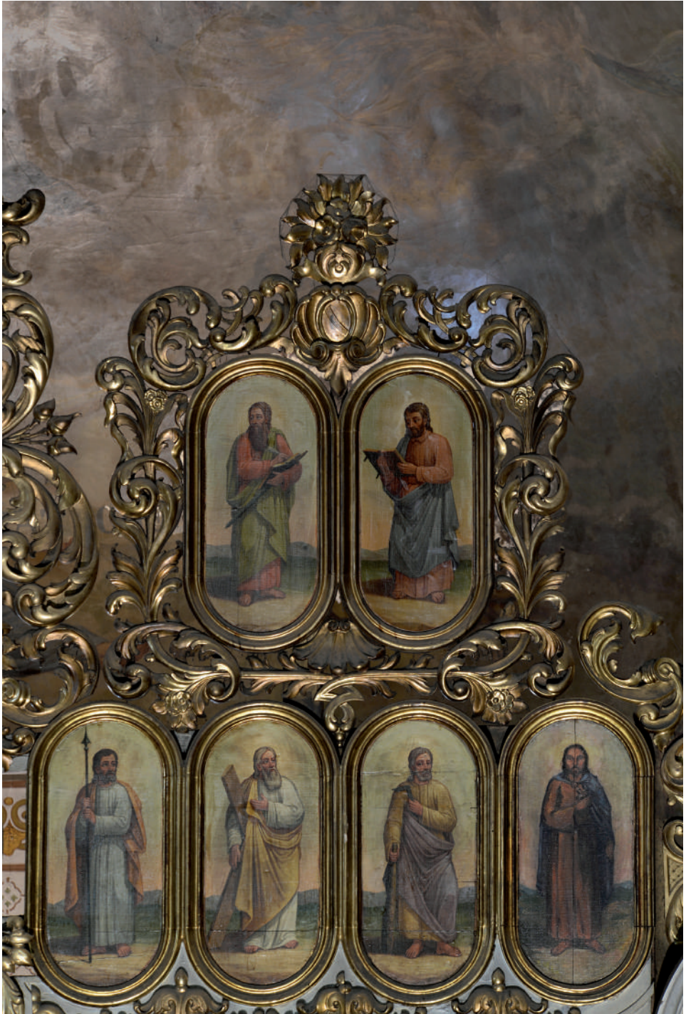
Sfinții Apostoli (detaliu)