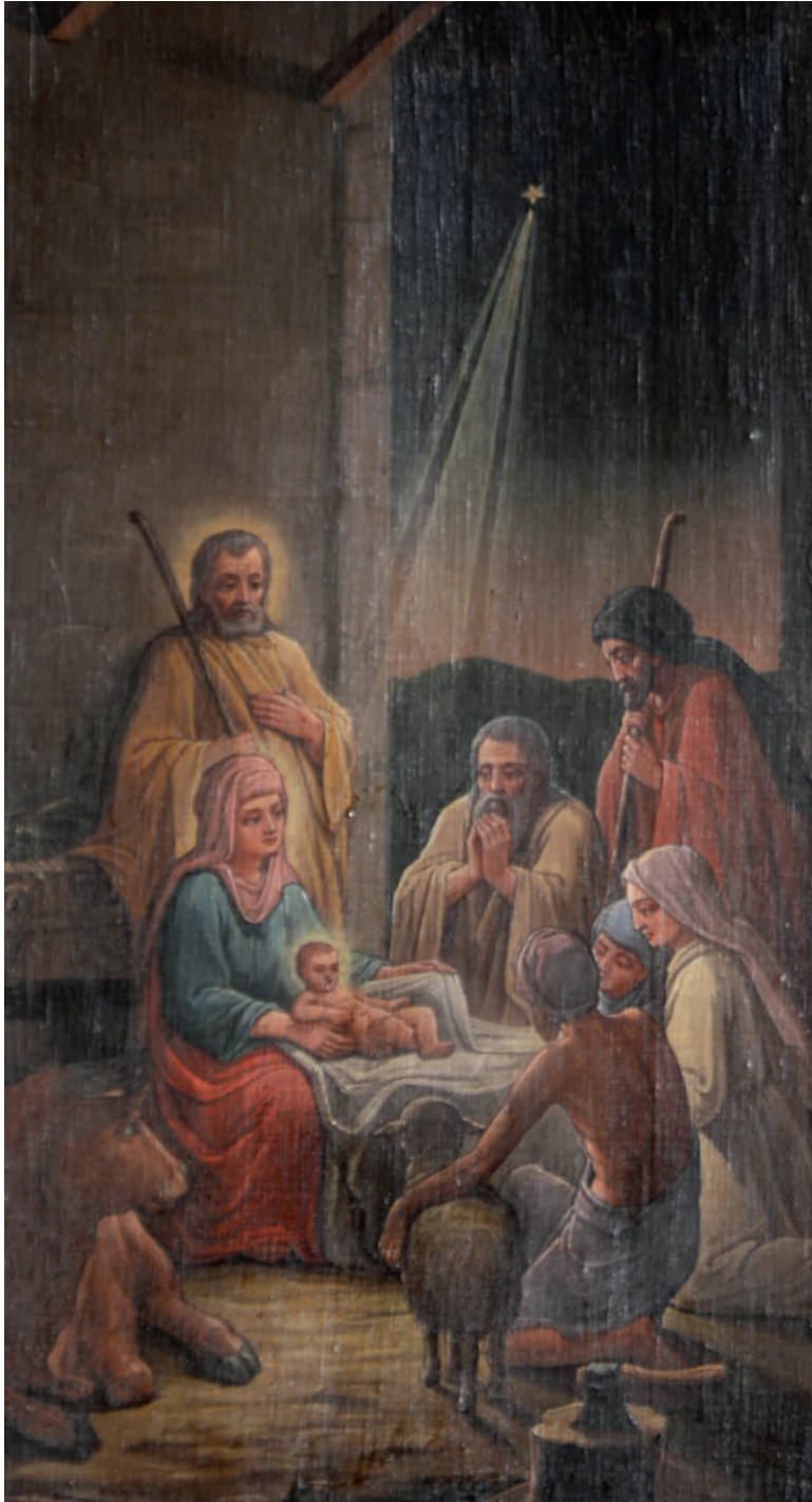
Nașterea Domnului (detaliu)