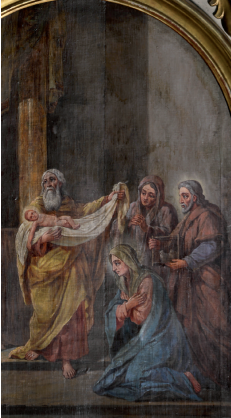
Întâmpinarea Domnului (detaliu)