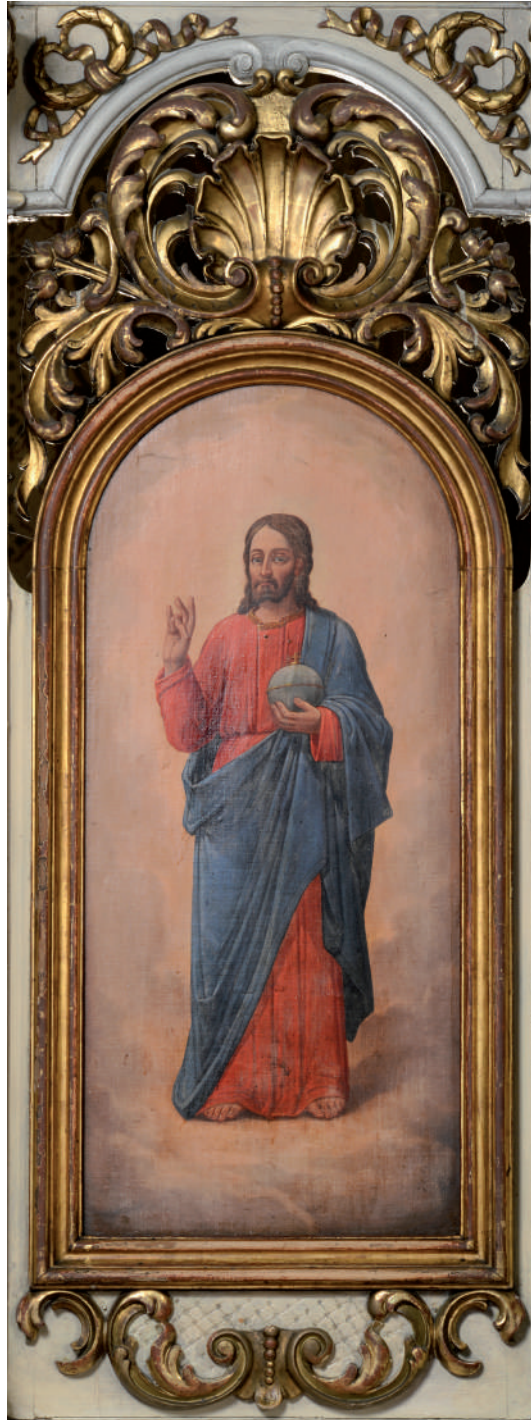
Mântuitorul Iisus Hristos