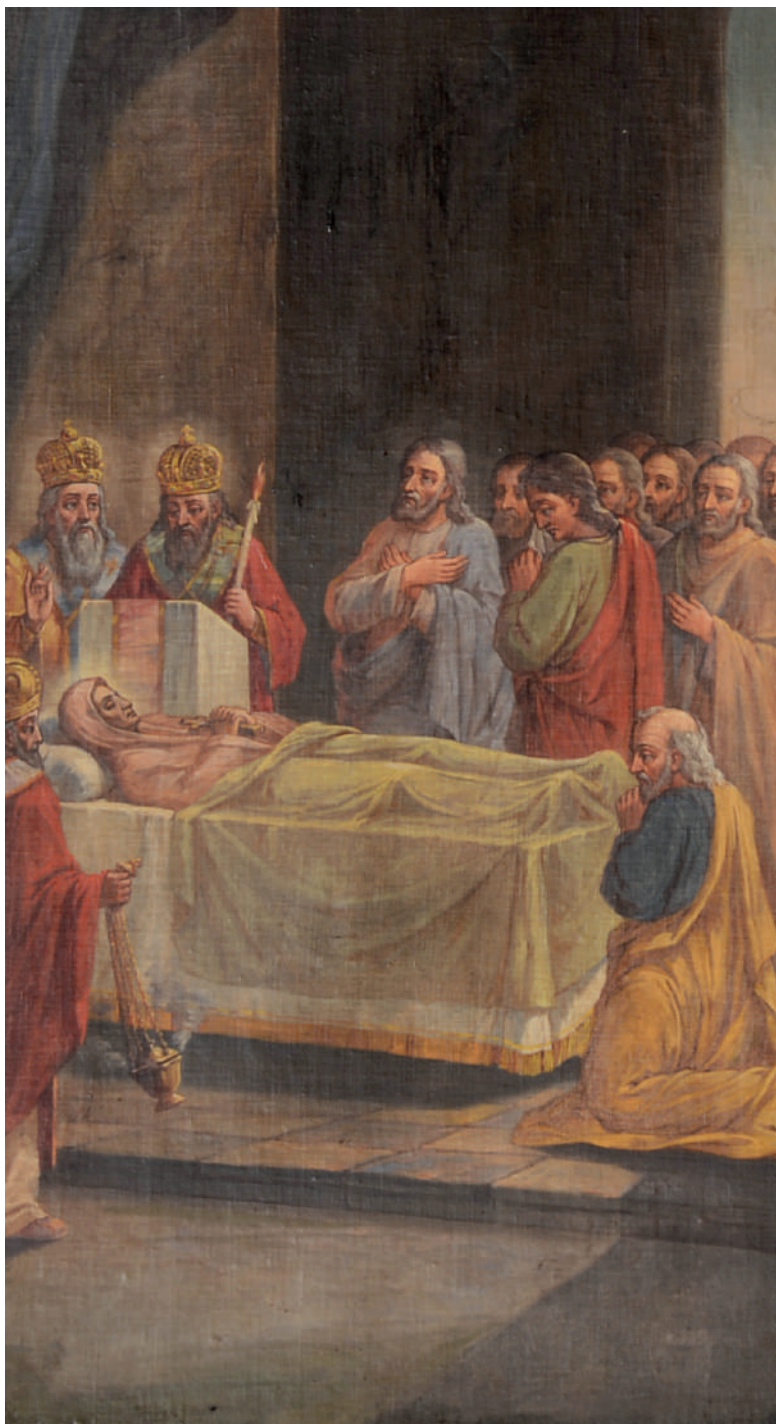
Adormirea Maicii Domnului (detaliu)