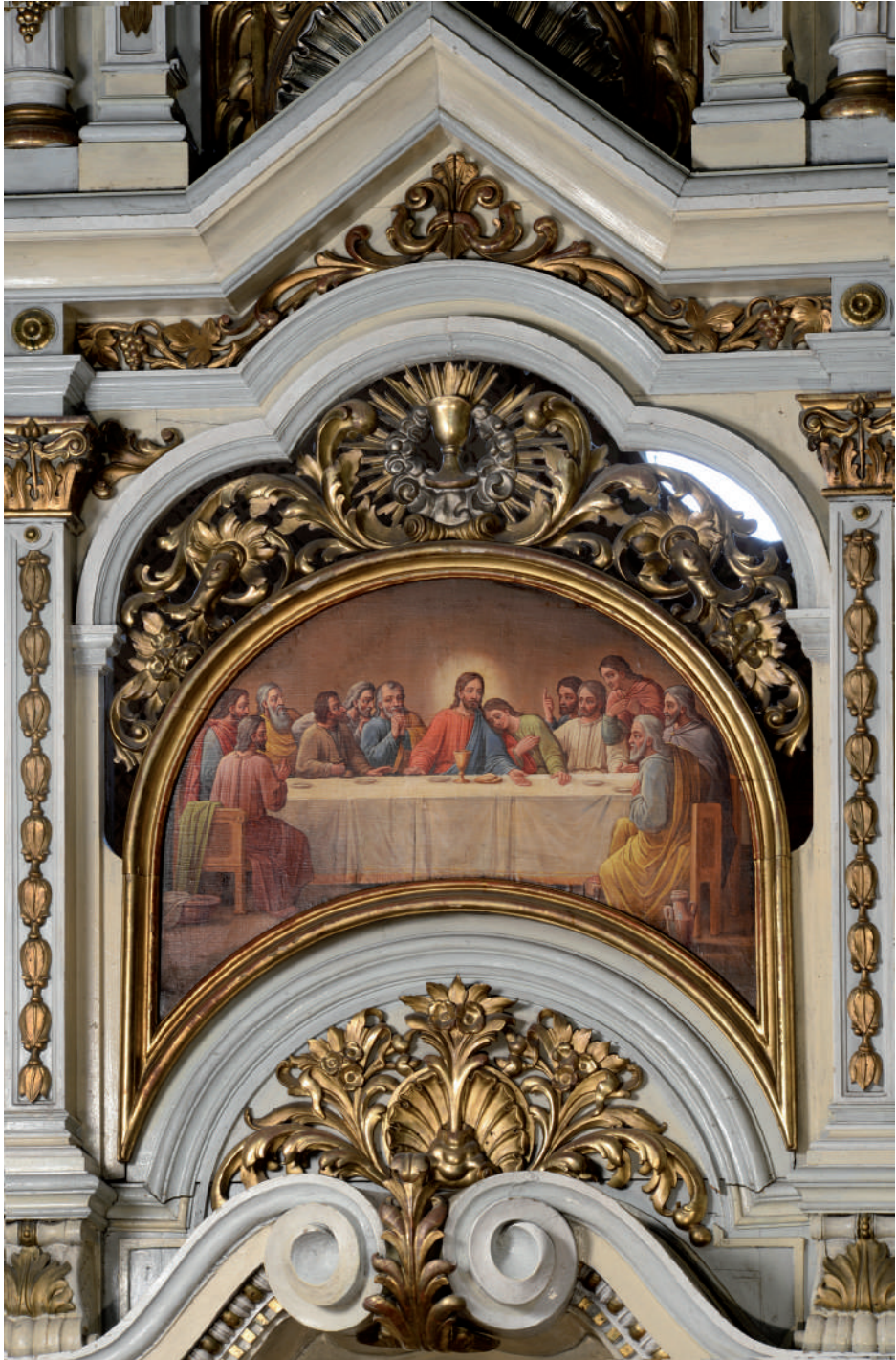
Cina cea de Taină