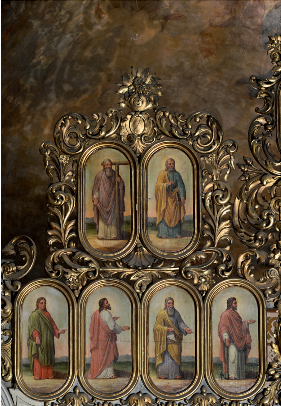
Sfinții Apostoli (detaliu)