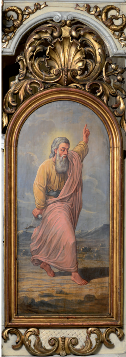
Sfântul Prooroc Ilie Tesviteanul