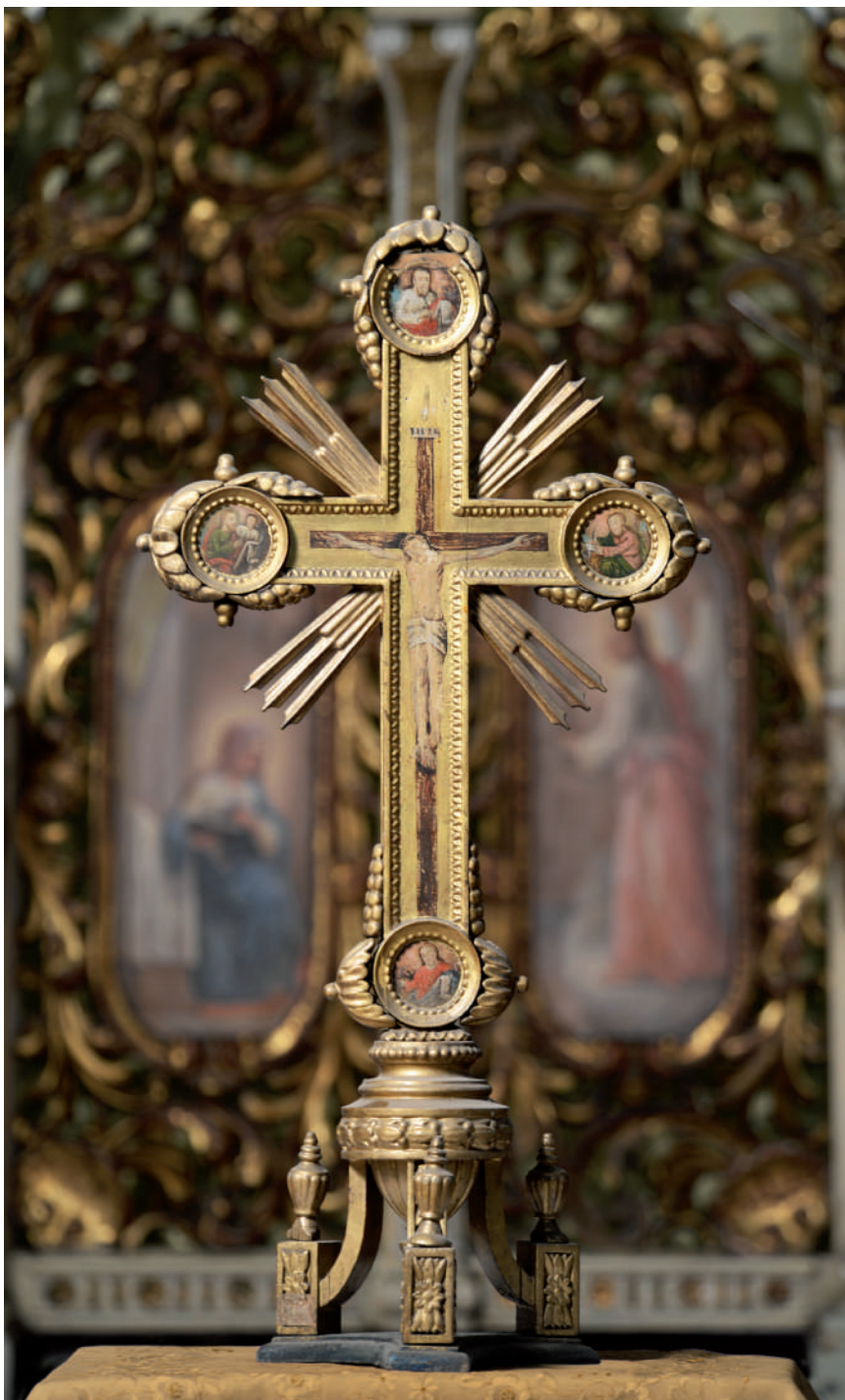
Sfânta Cruce (Fața 2)