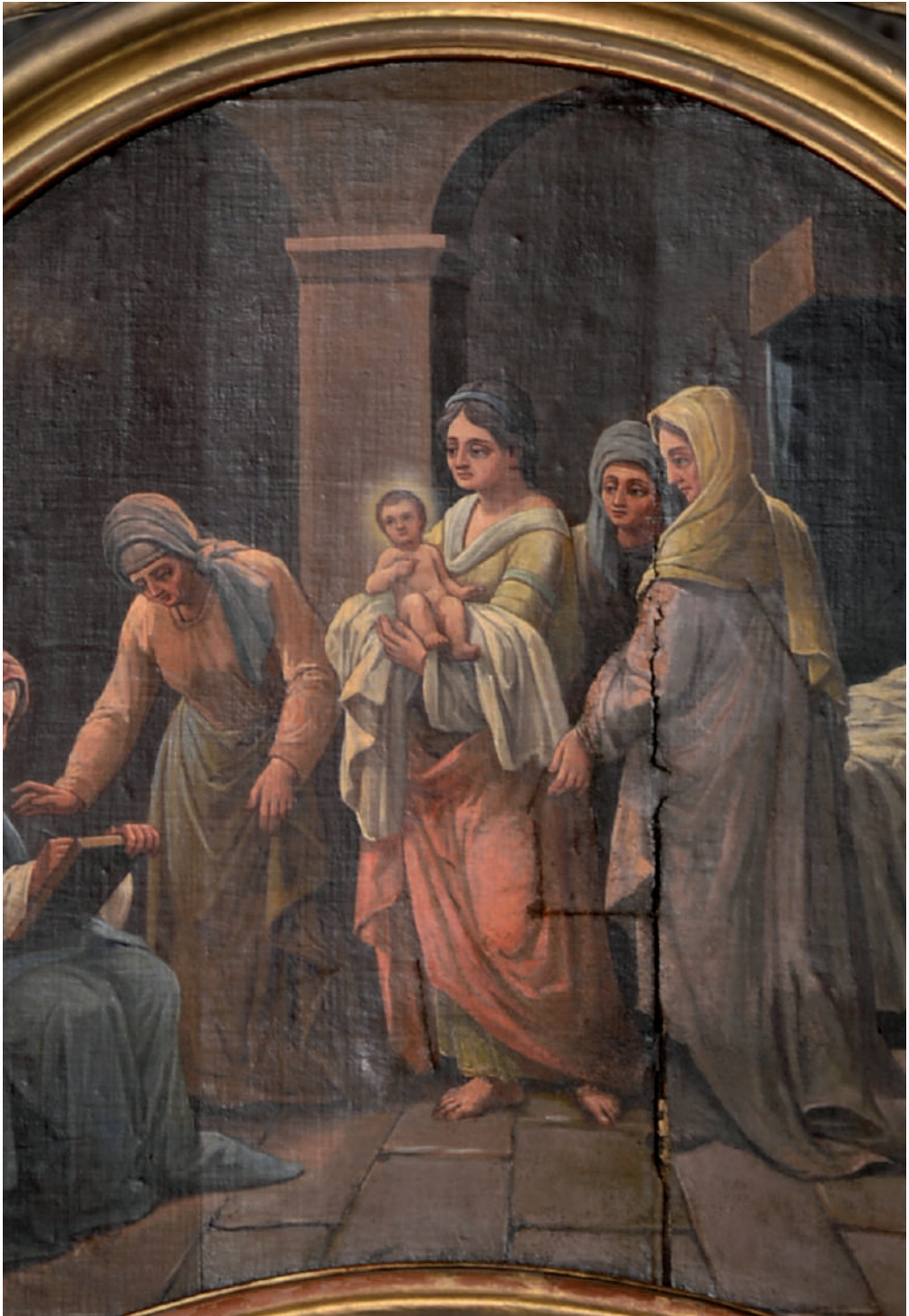
Nașterea Sfântului Ioan Botezătorul (detaliu)